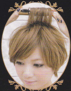
トップのボリュームアップ